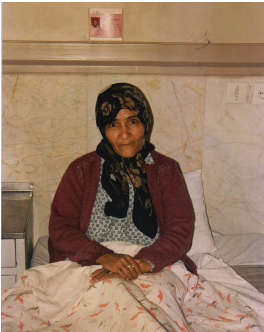
همان زن در آسایشگاه معلولین و سالمندان کهریزک، ۱۳۷۶.