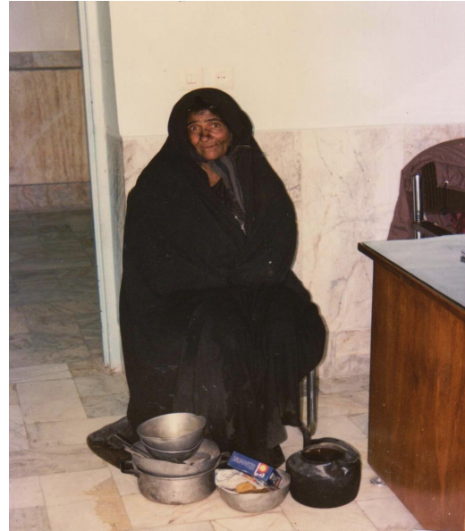
زنی آواره با خرت و پرت زندگی‌اش، ۱۳۷۵.