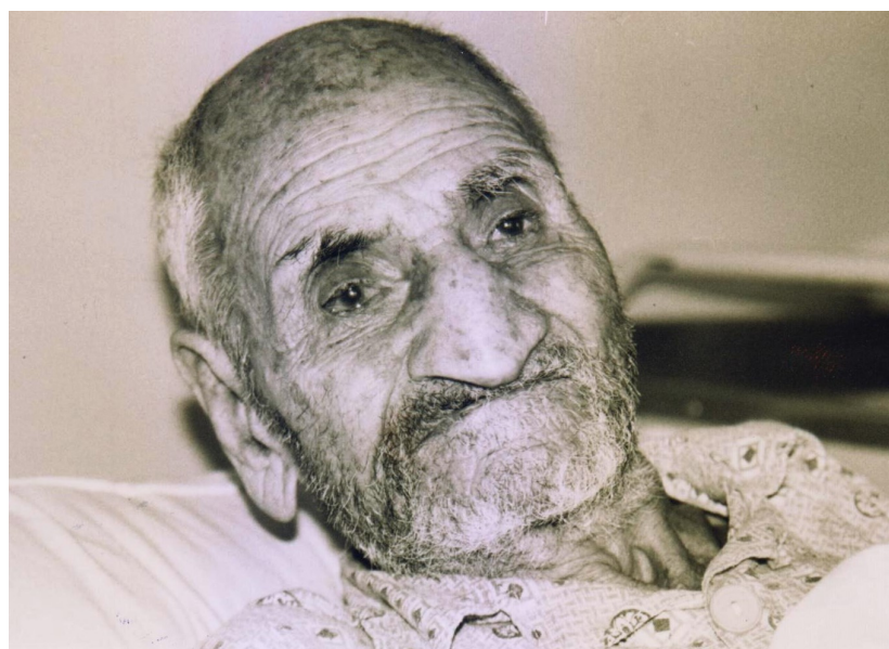
یک سالمند بستری در آسایشگاه معلولین و سالمندان کهریزک در نزدیکی تهران، در حدود پنج کیلومتری بهشت زهرا، ۱۳۷۶. (پژوهش ناصر پویان)